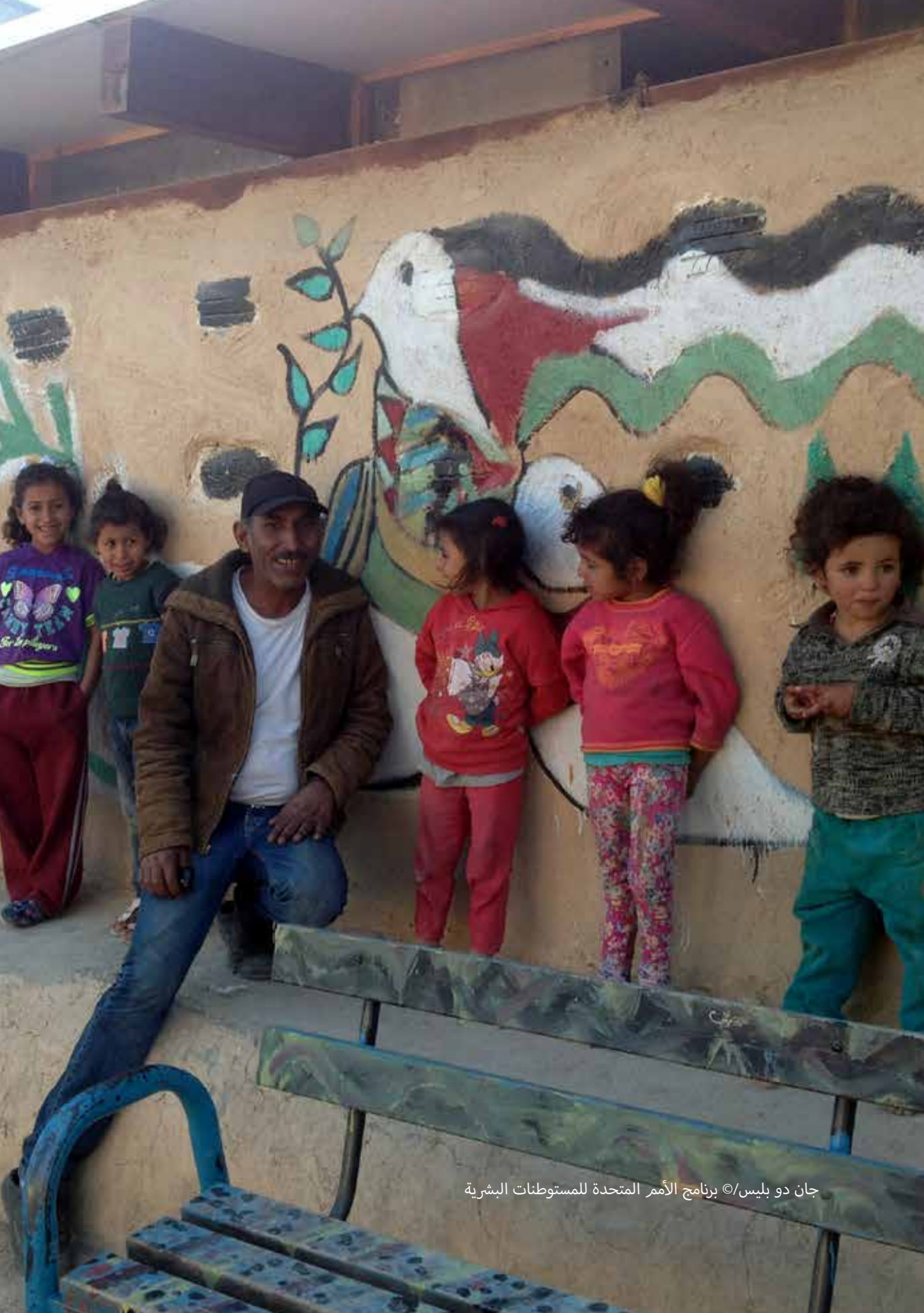
جان دو بليس/ برنامج الأمم المتحدة للمستوطنات البشرية