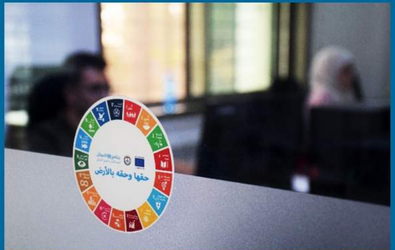
©الموئل (2022): شعار حملة التوعية حول الحقوق في الأراضي، هيئة تسوية الأراضي والمياه، رام الله

تم تأسيس هيئة تسوية الأراضي والمياه في آذار 2016 لتسريع عمليات تسوية الأراضي ودعم خارطة الطريق لإصلاح قطاع الأراضي التي أقرها مجلس الوزراء الفلسطيني في عام 2017. تسوية الأراضي والمياه هي عملية تسوية حقوق الملكية والقضايا المتعلقة بالأرض والمياه وفقاً لقانون تسوية الأراضي والمياه رقم (40) لسنة 1952. تتمتع هيئة تسوية الأراضي والمياه بالاستقلالية المالية والإدارية التي تمكنها من تحقيق أهدافها، والتي صيغت بموجب القانون رقم (7) لعام 2016 بهدف تسجيل وتوثيق وحل جميع القضايا والمطالبات المتعلقة بأي حق أو منفعة في الأرض والمياه في فلسطين.