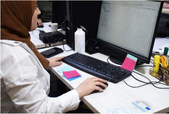
©الموئل (2022): تجهيز دائرة نظم المعلومات الجغرافي، هيئة تسوية الأراضي والمياه، رام الله

ما هو الدعم الذي قدمه مشروع "الحق في التخطيط والأرض في المنطقة ج، الضفة الغربية، فلسطين (2019-2023)" إلى وحدة نظم المعلومات الجغرافية؟